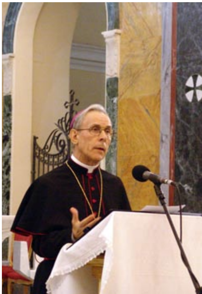
La Parola di Dio compia la sua corsa