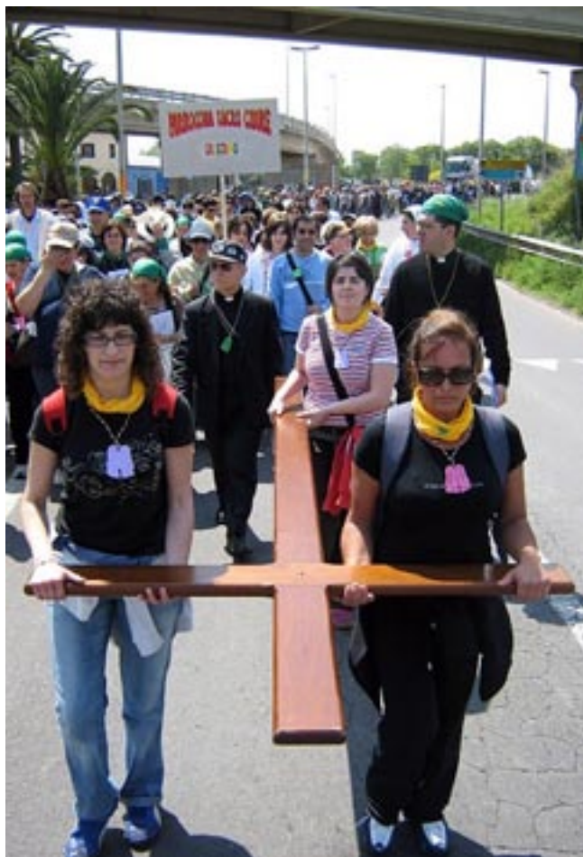
Pellegrinaggio Rimedio - Bonarcado, 1° maggio 2007