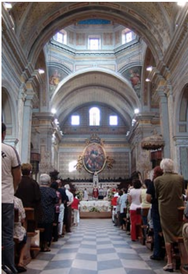
Cattedrale di Oristano - Assemblea in preghiera