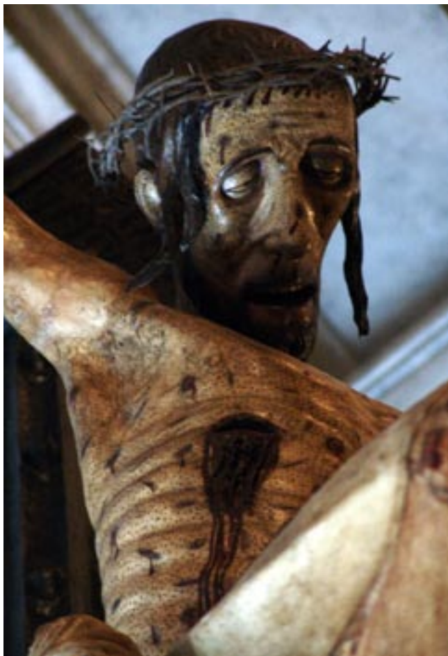
Chiesa di San Francesco (Oristano) - Cristo di Nicodemo (sec. XV)