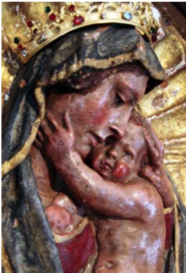
Santuario di Bonarcado (Oristano) - Madonna di Bonacatu